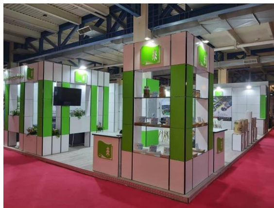
«Тетрис». Пример линейного стенда.

Базовое оснащение стенда «Тетрис» 9 000,00 руб. / кв.м (без учёта НДС) 90 € / кв.м (без учёта НДС)