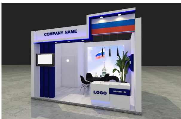
«Ostanorm». Пример углового стенда.