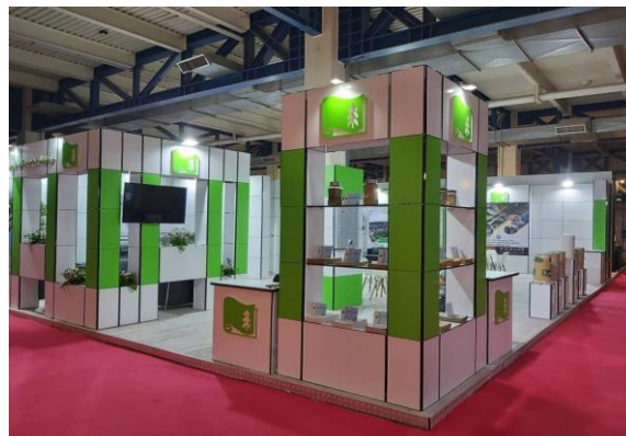
«Тетрис». Пример углового стенда.