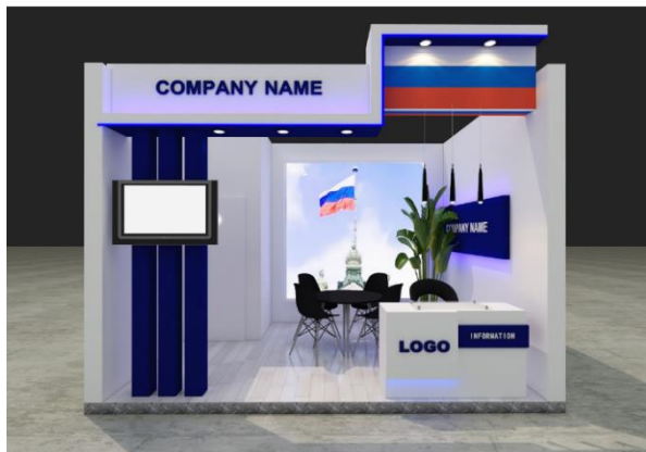
«Ostanorm». Пример линейного стенда.

Базовое оснащение стенда «Карен» 18 000,00 руб. / кв.м (без учёта НДС) 180 € / кв.м (без учёта НДС)